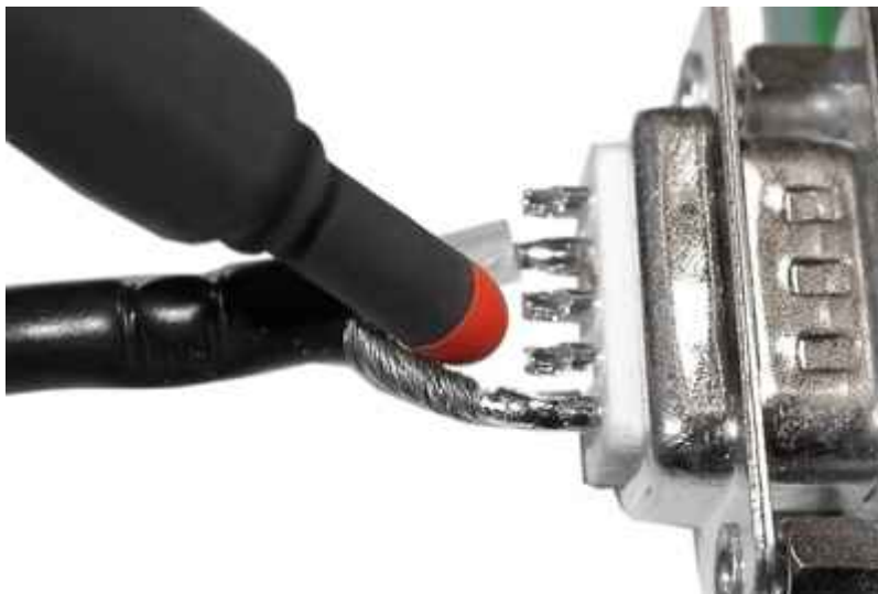
Application BS 04DB